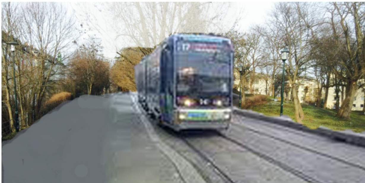
Omtrent slik vil det ta seg ut når trikken har tatt for seg av Tinkern.

Dette kan dessverre bli realitet om noen år hvis hovedalternativet til trasé til Fjordtrikken blir gjennomført. Statens Vegvesen i samarbeid med Ruter arbeider nå med detaljregulering for bl.a. Fjordtrikken over Filipstad. Det betyr i praksis at man vil anlegge en trikketrasé i gang- og sykkelveien som i dag går langs Tinkern. Som alle vil forstå er denne veien alt for smal til et dobbelt trikkespor. Derfor vil trikken kreve et minst 20 m bredt belte av Tinkern før den skal ut på et monster av en bro over Hjortneskrysset og videre ned i den nye bydelen på Filipstad.