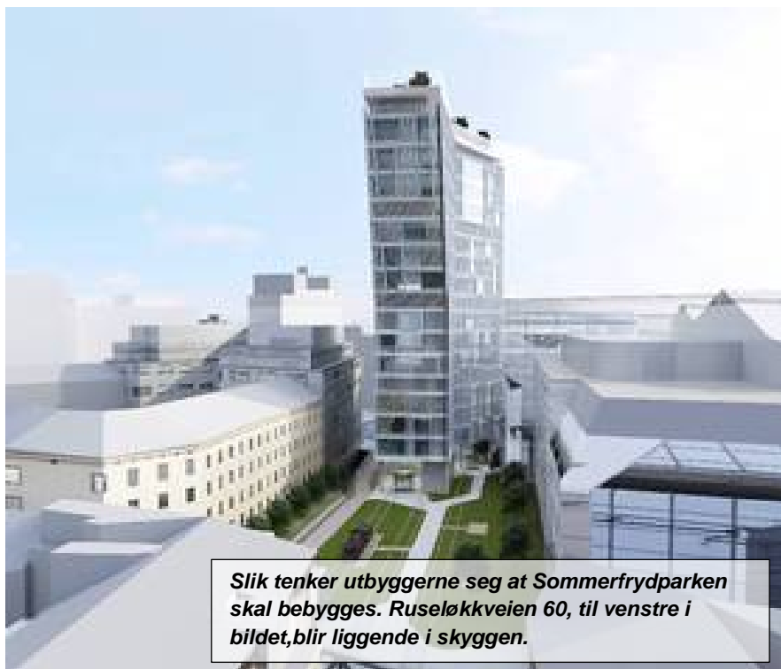
Slik tenker utbyggerne seg at Sommerfryd-parken skal bebygges. Ruseløkkveien 60, til venstre i bildet, blir liggende i skyggen.