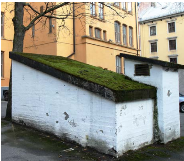
Bunkeren i Cort Adelers gate 33 lå under daværende Statens kvinnelige industriskole. Her hadde tyskernes lyttestasjon for det illegale radiosambandet med utlandet, spesielt med England.