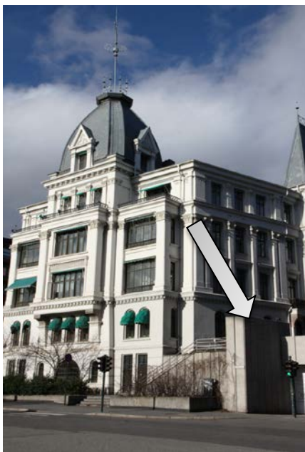
På Victoria terrasse, sydkvartalet, skal vi ha generalforsamlingen. Pilen peker på inngangen.